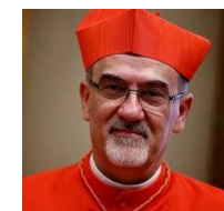
Cardinal P. Pizzaballa

Lieu : Eglise de Saint Nicolas de Flüe, paroisse Saint Jean XXIII (rue de Montbrillant 57 à Genève).