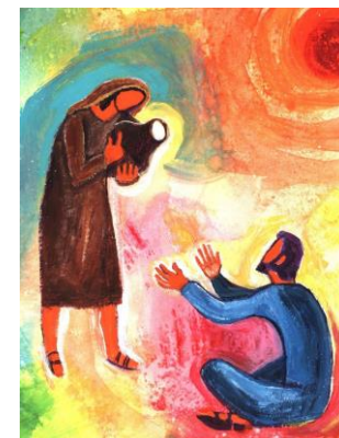
Peinture de Berna : evangile-et-peinture.org

Quand Jésus parle de la source jaillissante, il espère que l'eau qui émane du cœur des fidèles soit en mesure d'apaiser la soif de notre monde. La femme samaritaine nous donne l'exemple, elle annonce immédiatement à toute la ville : « J'ai rencontré le Messie ».