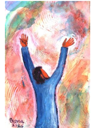
Peinture de Berna : evangile-et-peinture.org